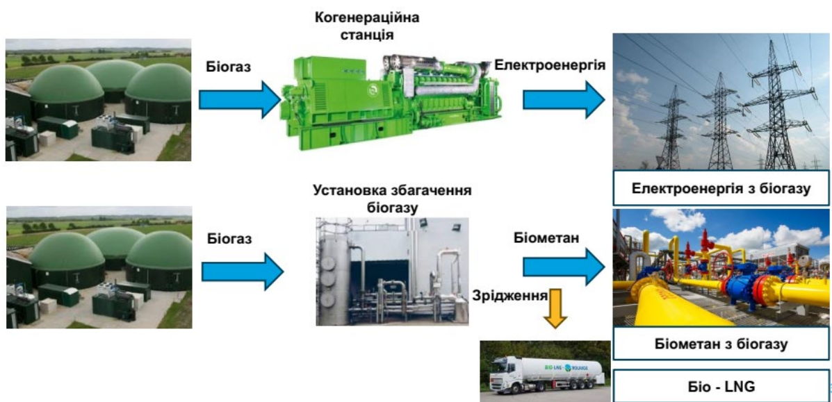
Рис. 3. Використання біогазу в Україні

Слід зазначити, що виробники біометану або інших видів газу з альтернативних джерел мають право на отримання доступу до газотранспортних і газорозподільних систем, газосховищ, установки LNG та на приєднання до газотранспортних та газорозподільних систем за умови дотримання технічних норм та стандартів безпеки