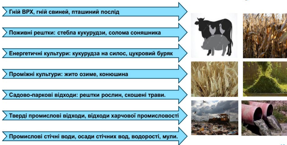
Рис. 1. Сировина для виробництва біогазу

В Україні біогаз активно використовується для виробництва електроенергії на біогазових установках, що сприяє локалізованому енергозабезпеченню та зменшенню викидів парникових газів. Окрім прямого спалювання, частина біогазу після очищення перетворюється на біометан, який може закачуватися в газові мережі для подальшого використання у комунальній та промисловій енер-